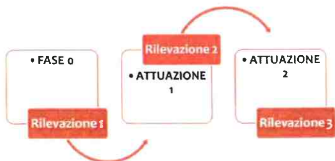
Figura 1. Il percorso di ricerca del programma P.I.P.P.I.

La possibilità di avere strumenti di conoscenza che documentino il rapporto tra il bisogno espresso dalla